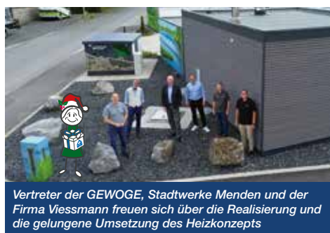
Vertreter der GEWOGES, Stadtwerke Menden und der Firma Viessmann freuen sich über die Realisierung und die gelungene Umsetzung des Heizkonzepts