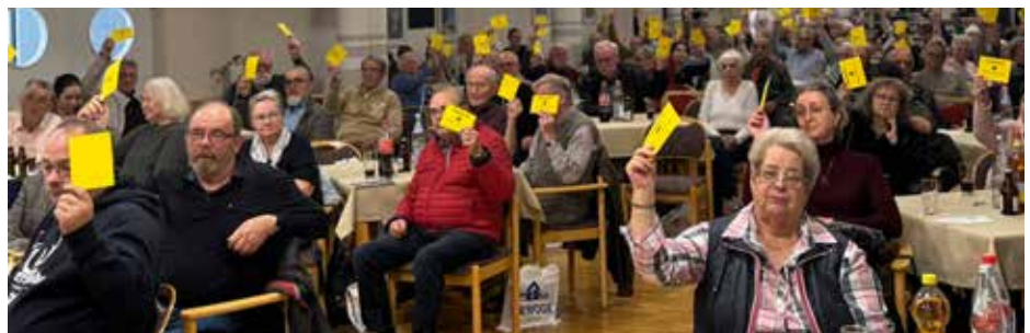
Viele Mitglieder machten von ihrem Mitbestimmungsrecht Gebrauch

Am 31. Oktober 2024 folgten erneut zahlreiche Mitglieder unserer Einladung zur diesjährigen Mitgliederversammlung. Im Restaurant des GEWOG -Seniorenzentrums informierten der Aufsichtsrat und der Vorstand die Mitglieder über vergangene und anstehende Aufgaben und anlässlich des 125-jährigen Unternehmensjubiläums kamen die Teilnehmer in den Genuß eines Imagefilms, in dem das GEWOG -Team die Hauptrollen belegte. Mit welchen Arbeiten beschäftigt sich das Team tagtäglich, welcher Mitarbeiter ist für welche Aufgabengebiete zuständig und wie gestaltet sich der Arbeitsalltag unserer Genossenschaft? Der Applaus der Versammlung zeigte, dass der Film, der einen Blick hinter die Kulissen der GEWOG ermöglichte, sehr gut ankam.