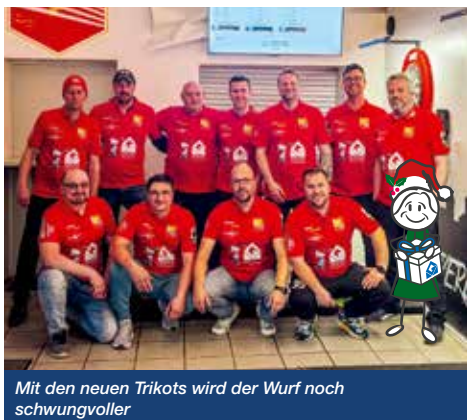
Mit den neuen Trikots wird der Wurf noch schwungvoller

Dart ist der Trendsport schlechthin und wird auch in Menden immer beliebter. Privat, aber auch in Vereinen treffen sich immer mehr Spieler, um ihre Treffsicherheit am Board zu verbessern.