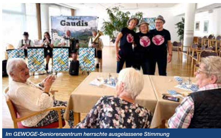
Im GEWOGES-Seniorenzentrum herrschte ausgelassene Stimmung

Die Bewohner des GEWOGES-Seniorenzentrums feierten im Herbst ihr eigenes Oktoberfest. Bei zünftiger Musik und bayerischer Dekoration kam schnell gute Stimmung auf. Die Mitarbeiterinnen servierten den Feiernden in standesgemäßer Kleidung leckere Speisen und Getränke. Und was wäre ein Oktoberfest ohne die passende Musik? Die vier Musiker der „Original-Gaudis“ begeisterten ihr Publikum mit ihrer Leidenschaft zu handgemachter Volksmusik. Zu den Klängen von Akkordeon, Klarinette, Tenorhorn und Trompete wurde mitgesungen, geklatscht und geschunkelt. Was für ein schöner Nachmittag!