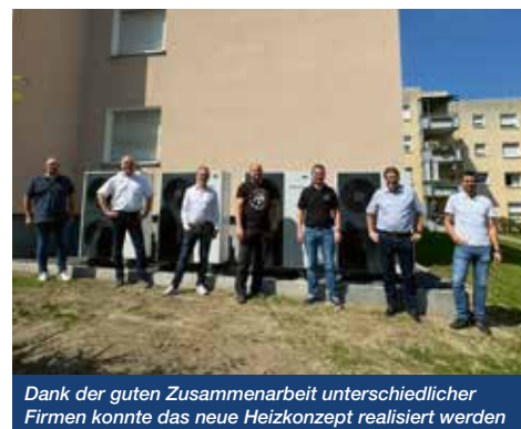
Dank der guten Zusammenarbeit unterschiedlicher Firmen konnte das neue Heizkonzept realisiert werden

wird, sondern verschiedene Einzelfallentscheidungen in der Zukunft angewandt werden. Ein gutes Beispiel für eine erste erfolgreiche Umsetzung ist ein Pilotprojekt an der Overhuesstraße. Bisher sorgten Gasetagenheizungen für Wärme in den 16 Wohnungen. Aufgrund ihres Alters hätte diese Anlage ohnehin bald ersetzt werden müssen, so dass dieser Umstand zum Anlass genommen wurde, erstmalig ein großes Objekt mit einer Gesamtwohnfläche von 1.160 m 2 mit Luft-/Wasserwärmepumpen auszustatten.