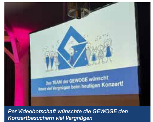
Per Videobotschaft wünschte die GEWOGE den Konzertbesuchern viel Vergnügen

Einfach super, dass wir uns bei allen GEWOGE-Veranstaltungen auf die Sängerinnen und