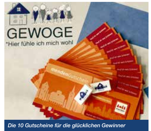
Die 10 Gutscheine für die glücklichen Gewinner

Die glücklichen Gewinner haben die Mendingutscheine bereits erhalten und stammen aus den unterschiedlichsten Ortsteilen von Menden (1 x Obsthof, 1 x Menden-Mitte, 1 x Halingen, 1 x Hüingsen, 6 x Lendringesen).