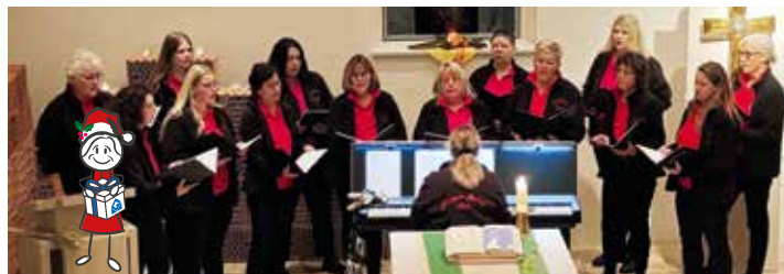
Die Sängerinnen des Hüngser Revival Chores freuen sich schon sehr auf das diesjährige Weihnachtskonzert

Es ist schon zu einer guten Tradition geworden, dass die Sängerinnen vom Hüngser Revival Chor kurz vor Weihnachten die Besucher ihres Konzertes auf das bevorstehende Fest einstimmen. Damit das Konzert stattfinden kann, ist eine Menge planerischer Arbeit im Vorfeld zu leisten und der Chor ist auch auf finanzielle Unterstützung angewiesen. Auch die GEWOGÉ hat gerne mit einem Spendenbetrag unter die Arme gegriffen. Seien Sie dabei und kommen Sie am Samstag, dem 21. Dezember 2024 in der Christ-König-Kirche in Hüngsen um 18:00 Uhr in den Genuss von schwungvollen und besinnlichen Weihnachtsliedern. Der Einlass beginnt ab 17:30 Uhr. Der Eintritt ist frei, um Spenden für eine soziale Einrichtung wird am Ende des Konzertes gebeten.